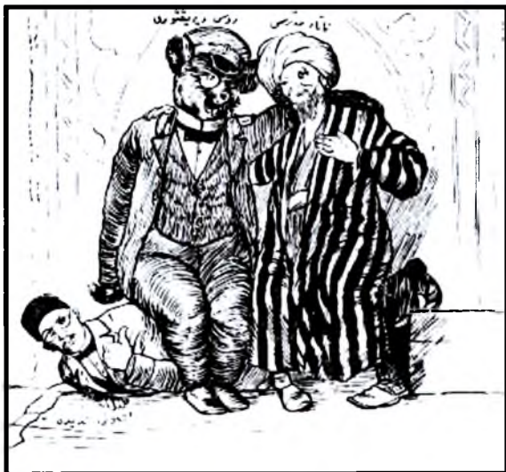
«Мулла Насриддин» журналида чоп этилган ўртоклик ҳазили. (И. Гаспринскийнинг маҳаллий дин пешволари ва рус амалдорлари томонидан қаттиқ эзилиши)

Рус миссионерларининг шу йўналишдаги хатти-хара- катларига биринчилардан бўлиб бош кўтариб чиққан ҳам И.Гаспринский бўлди. У мустамлакачилар томонидан олиб борилаётган сиёсатга бўлган муносабатини ўзининг машхур «Русия мусулмонлиги» (1881) асарида изохлаб берди.