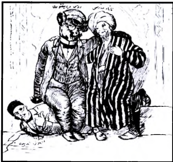
Карикатура, опубликованная в журнале «Молла Насреддин» (И. Гаспринский под сильным давлением русских чиновников и местных фанатиков)

Гаспринский, основав школы «усули джадид» в Крыму, принялся за внедрение этого проекта и на других заселенных мусульманами территориях. По его мнению, толчком к выводу мусульман из отсталости должно было стать обновление образования, метода обучения.