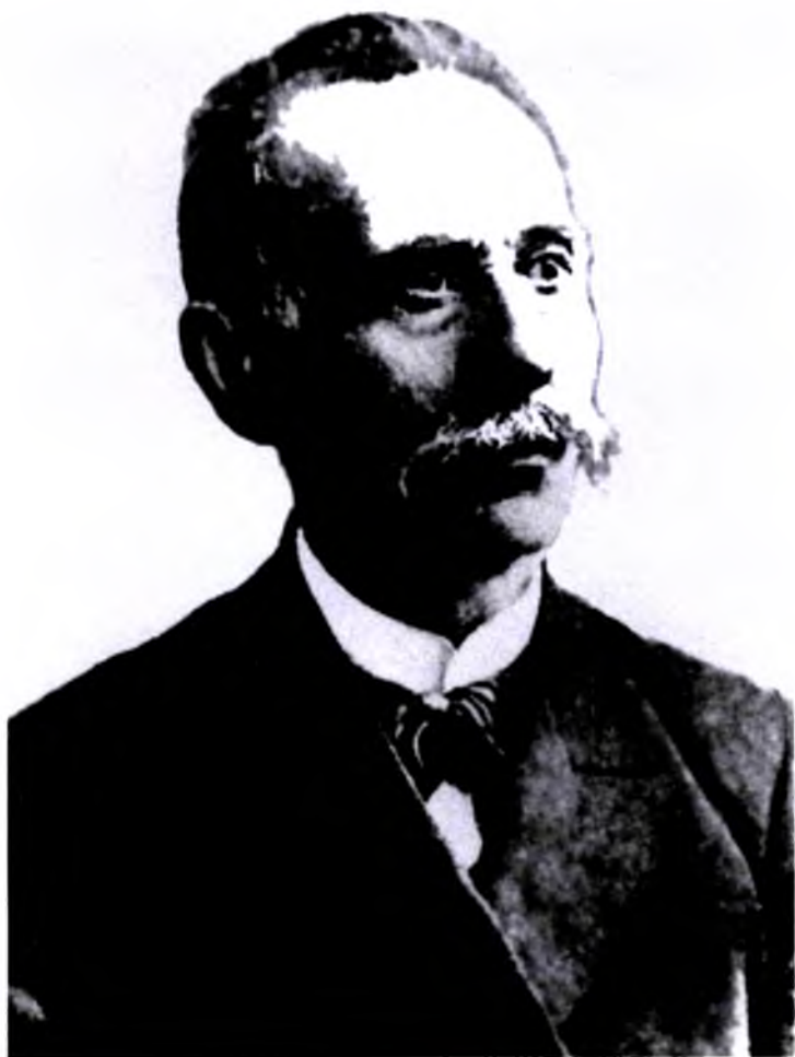
Исмоилбек Гаспринский (1851 – 1914)